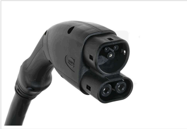
图片仅用于说明。请参考产品描述。